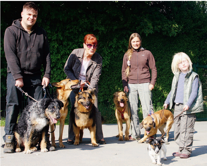
Stützen des Tierschutzvereins: Die ehrenamtlichen Gassigänger sind unverzichtbar – für Hund und Mensch.

Die freiwilligen ehrenamtlichen Helfer sind das wichtigste Fundament, auf das der Tierschutzverein Bad Salzuflen-Lemgo e.V. baut. Ohne die vielfältige ehrenamtliche Unterstützung würde insbesondere das Tierheim in Bad Salzuflen, dessen Träger der Verein ist, gar nicht „stehen“.